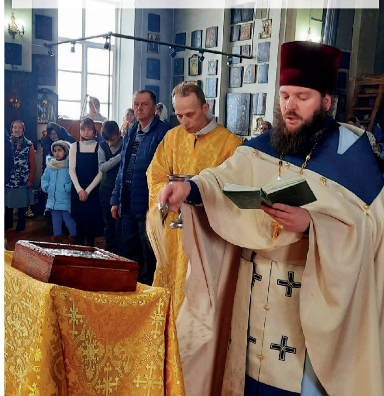
Фото: Освящение иконы