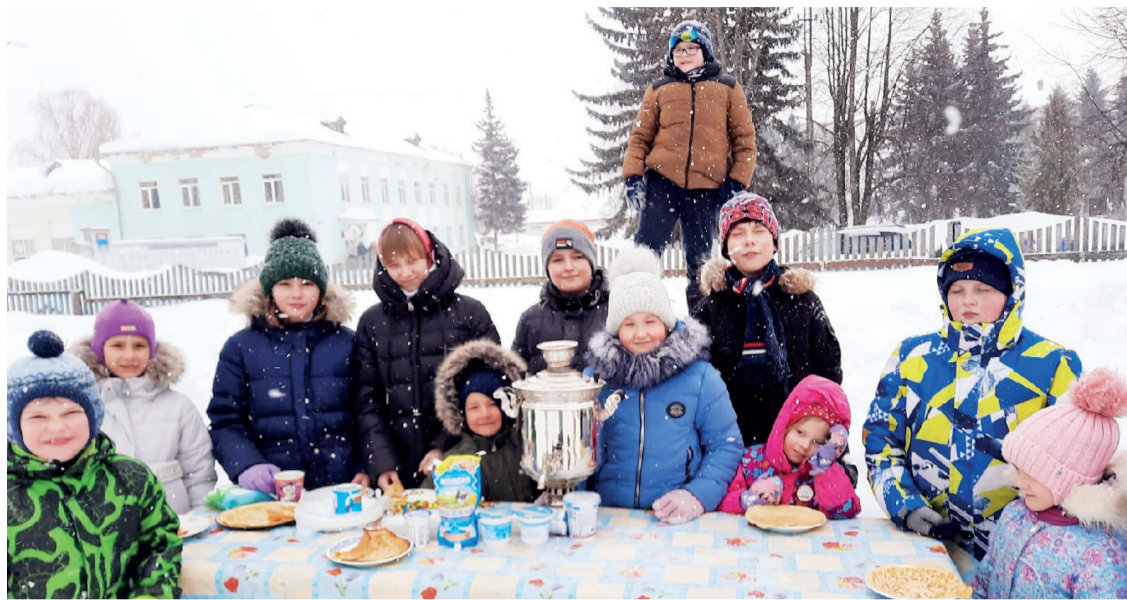
Фото: Великий пост, 2021 г.

Настоятель, Приходской совет, Приходское собрание и прихожане поздравляют с днем рождения :