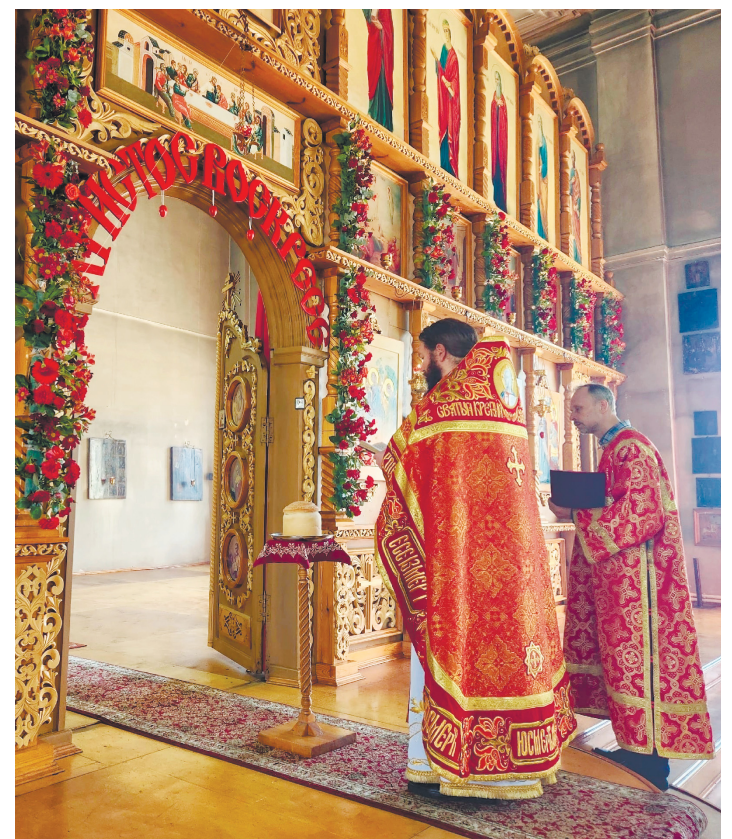
Фото: Пасха, 2023 г. (из архива Прихода)