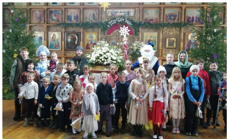
Славение и поздравление с Рождеством Христовым, 8 января 2021 г.

Продолжаются работы по кладке стен четверика, парусов малых барабанов и нефов и алтарного свода.