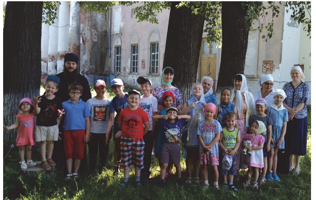
Лагерь Прихода, общая фотография

28 августа в 11:00 в Соборе будет отслужен молебен перед началом нового учебного года.