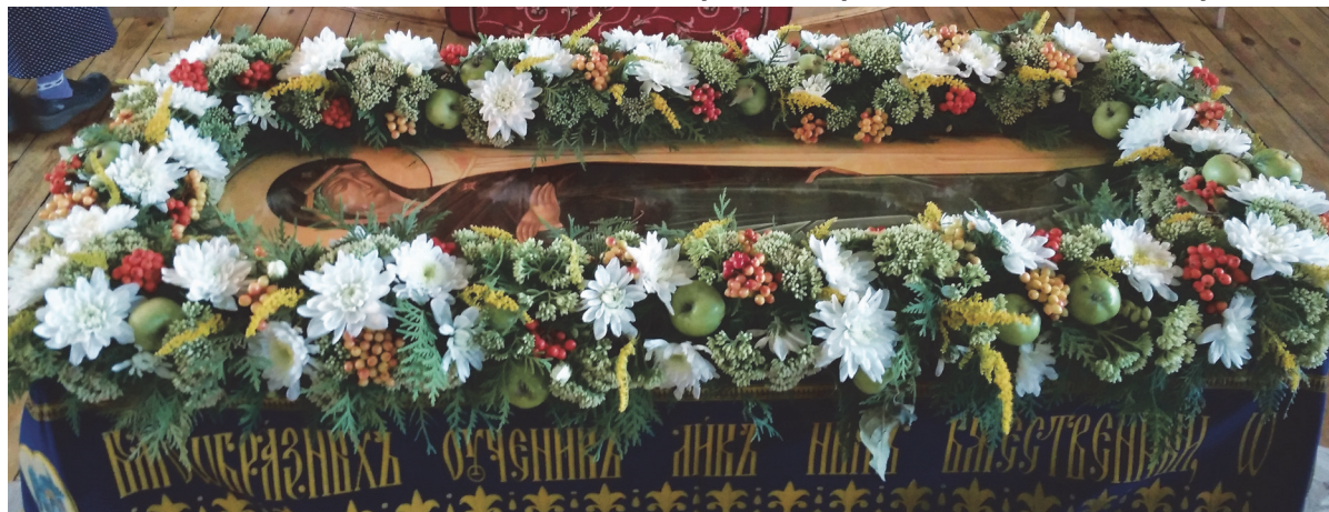
Фото: Украшение Креста и Плащаницы в Соборе, 2017 г.

«ИХ ГЕРОЙСКИЙ ПОДВИГ НЕ ЗАБУДЕТ ИСТОРИЯ И БУДУЩЕЕ ПРИЗНАТЕЛЬНОЕ КУЛЬТУРНО-БЛАГОРОДНОЕ ЧЕЛОВЕЧЕСТВО»