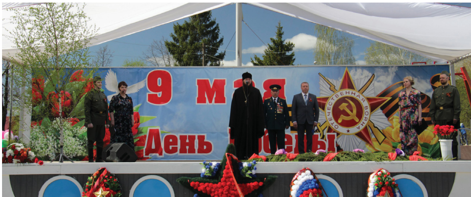
Митинг-концерт, 9 мая 2018 г.

В настоящее время продолжают работы по закладке оконных проемов второго яруса окон алтаря храмовой части Собора.