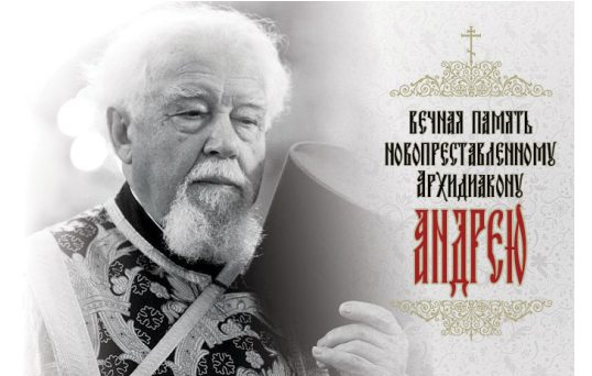
Материал подготовлен иереем Романом Смирновым

Отпевание почившего совершено 5 мая в Свято-Троицком соборе Александро-Невской лавры, митрополитом Санкт-Петербургским и Ладожским Варсонофием. Тело погребено на Никольском кладбище монастыря.