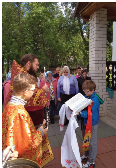
Крестный ход, 7 июня 2018 г.