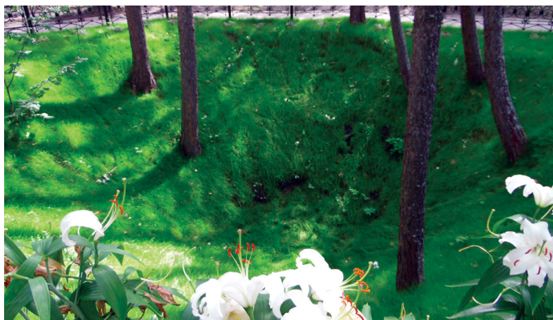
Шахта № 11