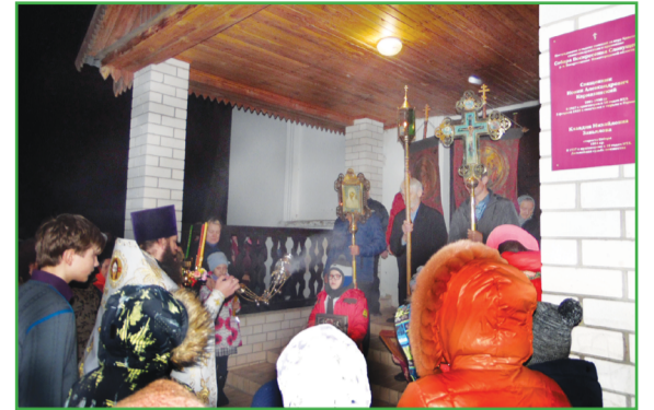
Начало Пасхальной Утрени. 8 апреля 2018 г.